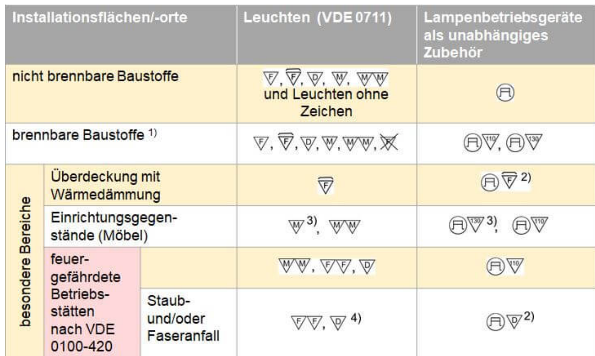
Tabelle 1 der Norm zeigt übersichtlich, mit welchen Kennzeichen die Installationsflächen und -orte zu versehen sind:

In der Übersicht (DIN VDE 0100-559 Tab. 1) sind insbesondere die zum Schutz vor Bränden geltenden Auswahlkennzeichen zusammengefasst.