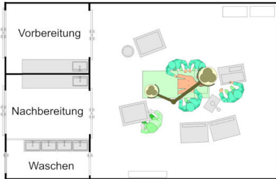
Medizinisch genutzte Bereiche der Gruppe 2

Die Einteilung in eine dieser Gruppen ist Voraussetzung für