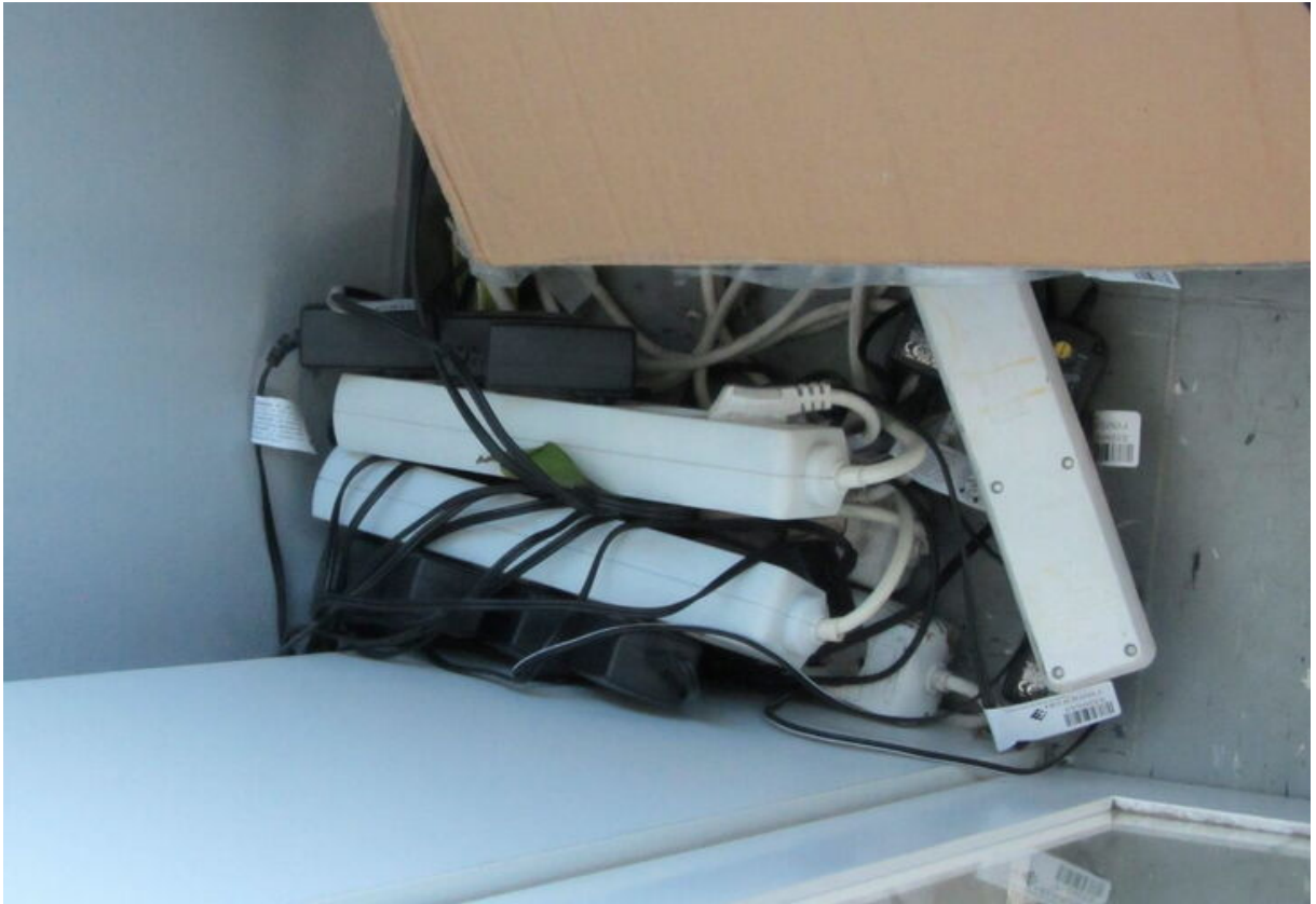
Unzulässiges Hintereinanderschalten von Steckdosenverteilern