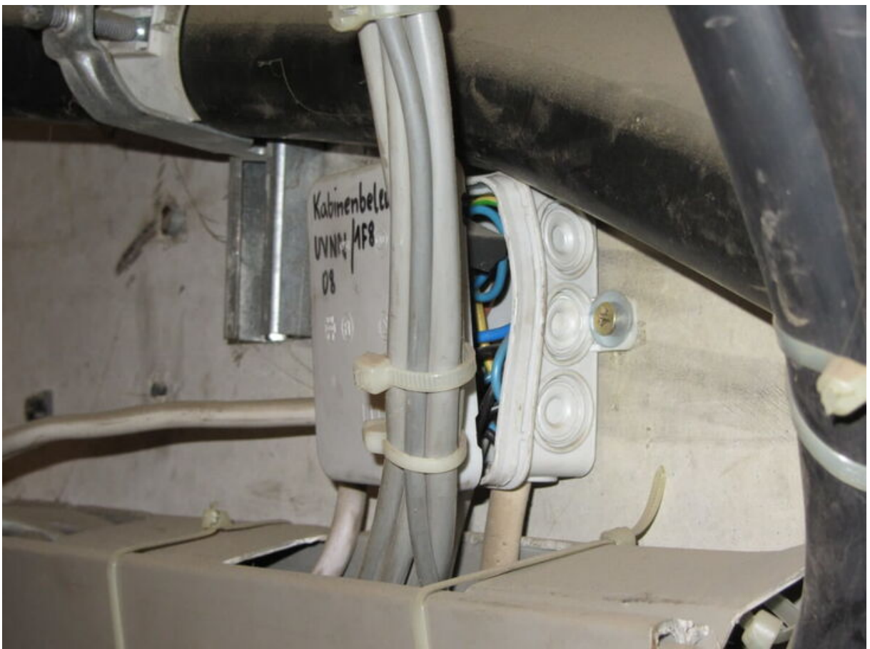
Außer Kraftsetzen des Schutzgrades