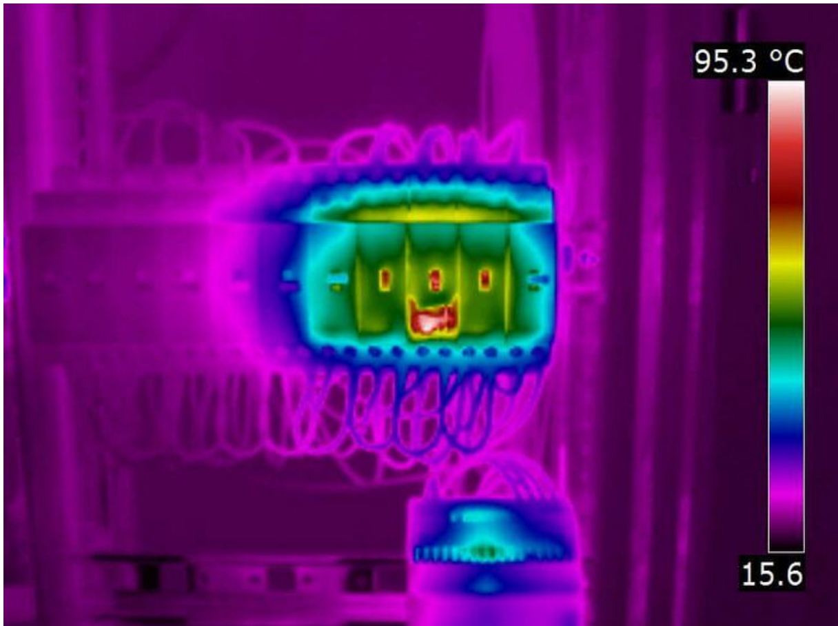
Überhitzung eines LS-Schalters aufgrund eines Isolationsfehlers