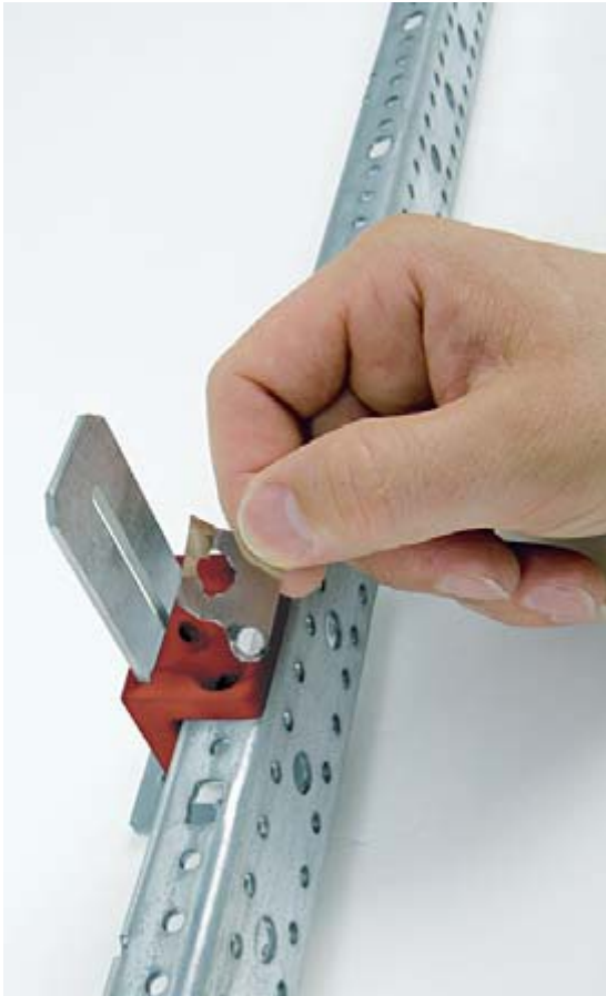
Abb. 3: Bei den neuen Tiefbauwinkeln wird zur schutzisolierten Montage einfach das Metallplättchen entfernt. Es sind keine zusätzlichen Isolierstücke mehr erforderlich.

Entsprechend der Forderung aus VDE 0198:2008-02 Abschnitt 5.3.2 ist die als Schutzleiter verwendete Hutprofilschiene als Schutzleiter zu kennzeichnen .