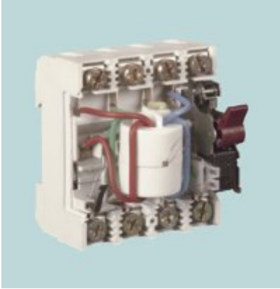
Innenansicht eines Fehlerstrom-Schutzschalters

Die aktiven Leiter (L1, L2, L3 und N), die vom Netz zu dem Verbraucher führen, werden durch einen sogenannten Summenstromwandler geführt, der in der Regel aus einem Ringkerntransformator besteht.