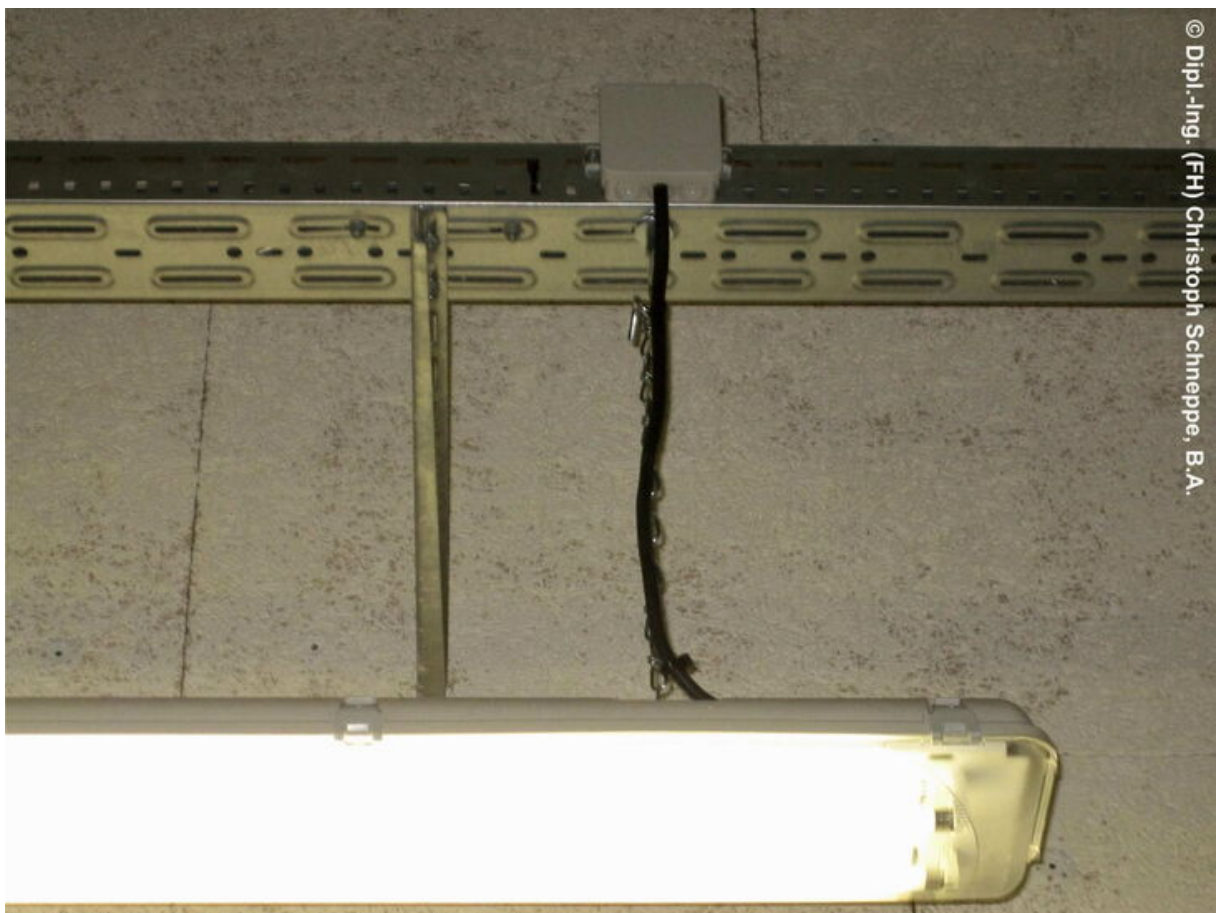
Leuchtstofflampe mit einer flexiblen Anschlussleitung, die an Ketten abgehängt ist

Die folgende Abbildung zeigt eine Leuchtstofflampe, die mit einer flexiblen Zuleitung ausgestattet ist.