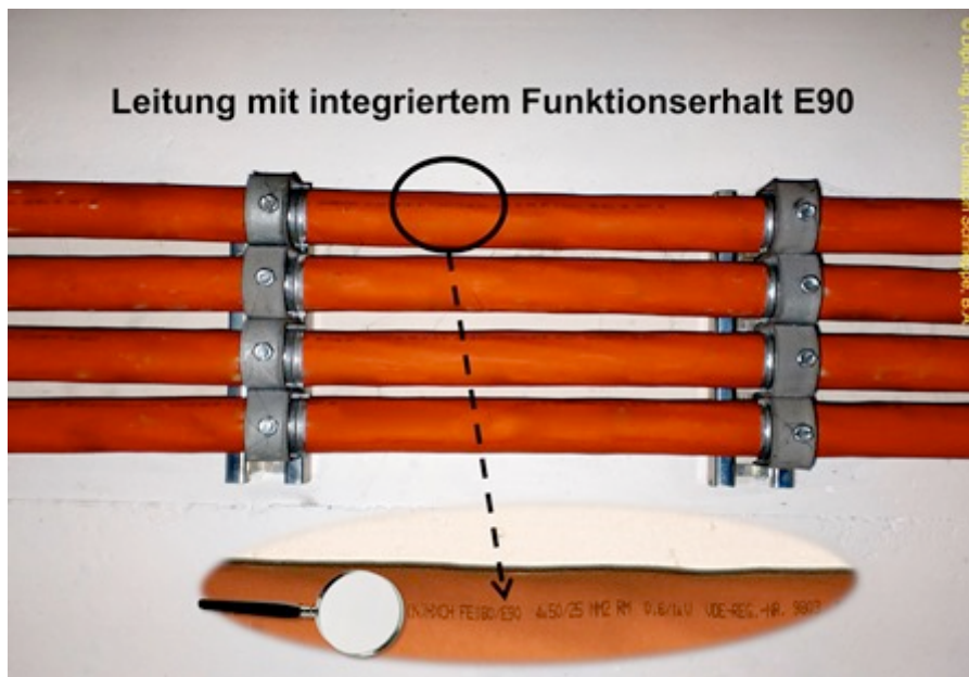
Leitung mit integriertem Funktionserhalt E90