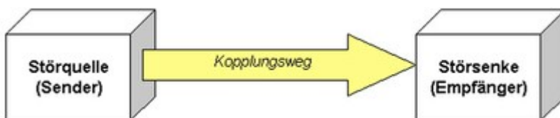
Abb. 2: Beeinflussungsmodell

Über einen Kopplungsmechanismus wird das Störsignal übertragen (siehe Abb. 2). Kopplungsmechanismen in diesem Sinne sind z.B. die elektrische, magnetische oder elektromagnetische Feldkopplung sowie die Kopplung über Leitungen und über die Masse.