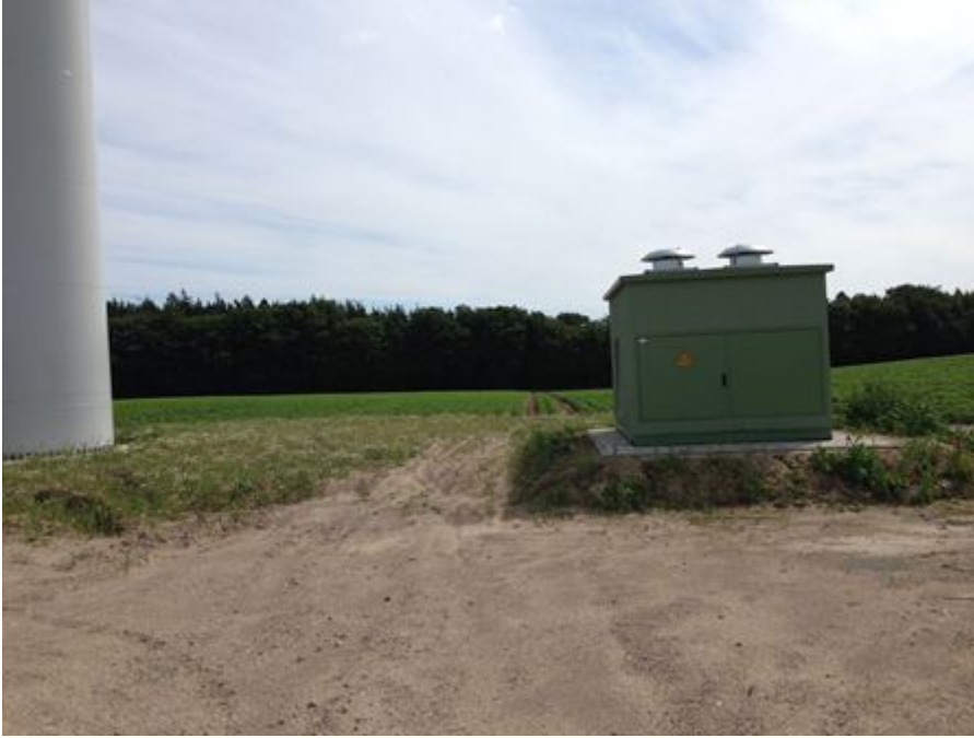
Abb. 4: Typische Installationsanordnung der Mittelspannungs-Einrichtungen bei einer Multimegawatt-Windenergieanlage