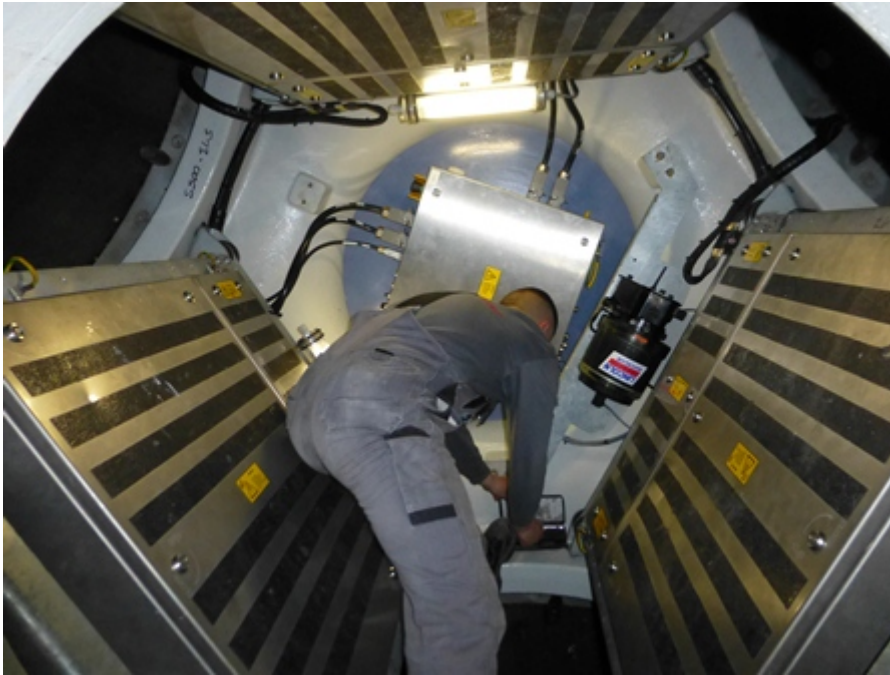
Abb. 5: Innenbereich der Nabe

Ausgenommen hiervon sind Arbeiten an Akku-Notversorgungen (z.B. zur Rotorblattverstellung oder Hindernisbefeuern) unter Beachtung geeigneter Schutzmaßnahmen, die in Montage- oder Arbeitsanweisungen festgelegt sein müssen. Abbildung 5 zeigt den Innenbereich der Nabe, wo die Akku-Notversorgung für die Rotorblattverstellung installiert wird.