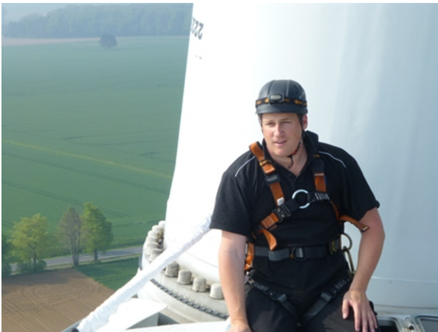
Abb. 6: Geeignete persönliche Schutzausrüstung

Die Einrichtungen, Anordnungen und Maßnahmen müssen den allgemein anerkannten Regeln der Sicherheitstechnik, der Arbeitsmedizin und der Hygiene sowie den sonstigen gesicherten arbeitswissenschaftlichen Erkenntnissen entsprechen. Der Unternehmer hat die getroffenen Maßnahmen auf ihre Wirksamkeit zu überprüfen und erforderlichenfalls sich ändernden Gegebenheiten anzupassen.