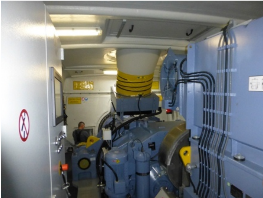
Abb. 3: Maschinenhaus einer Multimegawatt-Windenergieanlage

Die gesamte Windenergieanlage als auch zugehörige Nebengebäude mit den enthaltenen elektrischen Anlagen sind als abgeschlossene elektrische Betriebsstätte zu betreiben. Die Zugangsberechtigung darf nur Elektrofachkräften (EFKs) oder elektrotechnisch unterwiesenen Personen (EuPs) erteilt werden. Andere Personen sind durch Elektrofachkräfte oder elektrotechnisch unterwiesene Personen zu beaufsichtigen.