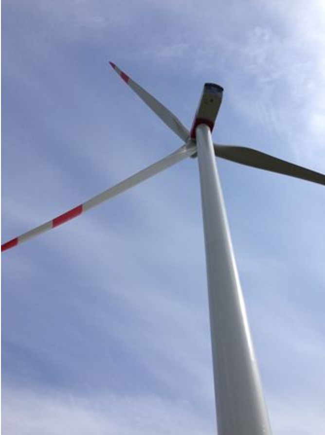
Abb. 1: Moderne Multimegawatt-Windenergieanlage