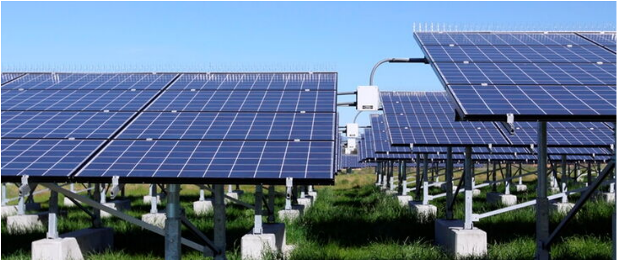
Photovoltaikanlage nach dem derzeitigen Stand der Technik

Die Elektrosicherheit bei Photovoltaikanlagen (PV-Anlagen) wird im Wesentlichen gewährleistet durch ein systematisches Schutzkonzept gegen elektrischen Schlag für einen sicheren technischen Betrieb der Anlage über die Betriebszeit von 20 Jahren.