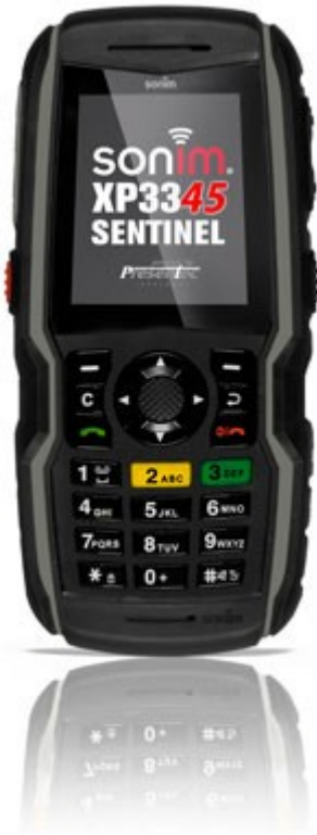
GSM-Mobilfunknetz PNA-11-Endgerät