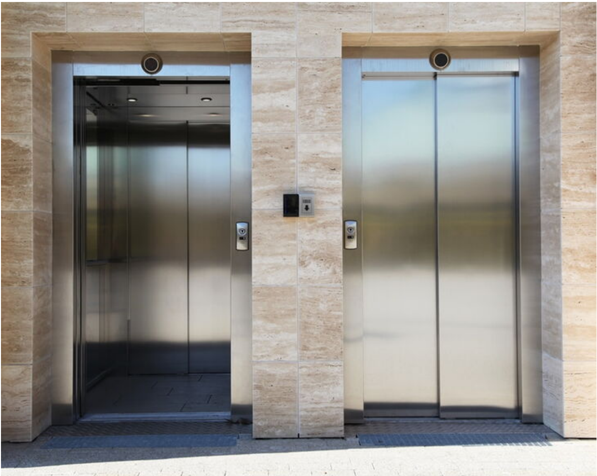
Die BetrSichV stellt besondere Anforderungen an Aufzugsanlagen.

Diesen Missständen will die Betriebssicherheitsverordnung abhelfen, u.a. durch folgende Vorgaben: