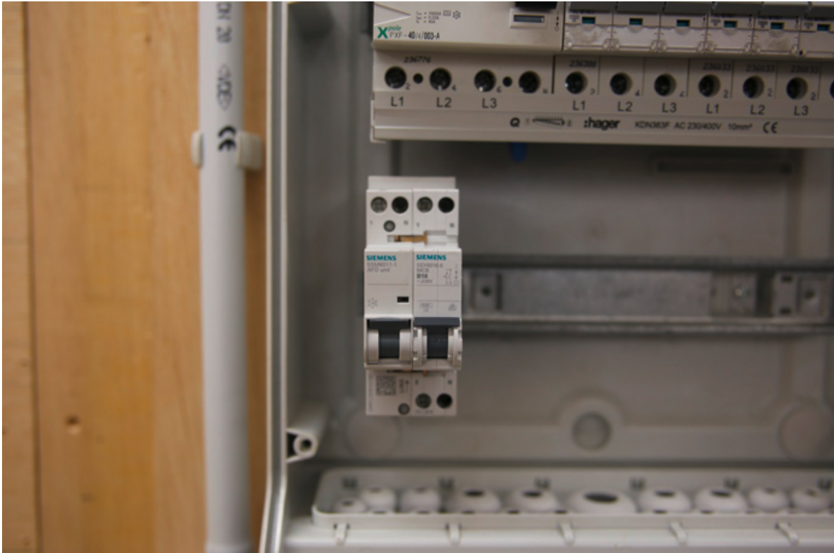
AFDDs sollen die Brandprävention verbessern und Brandfälle verringern.

Eine der wichtigsten Neuerungen ist die Aufnahme zusätzlicher Anforderungen zur automatischen Abschaltung bei gefährlichen Lichtbögen. Fehlerlichtbogen-Schutzeinrichtungen, im Technik-Jargon auch AFDD genannt (Arc Fault Detection Device), sollen die Brandprävention verbessern und die Zahl der Brandfälle deutlich verringern. Die Norm enthält einen Anhang A mit Informationen zu den unterschiedlichen Ausführungsformen von AFDDs.