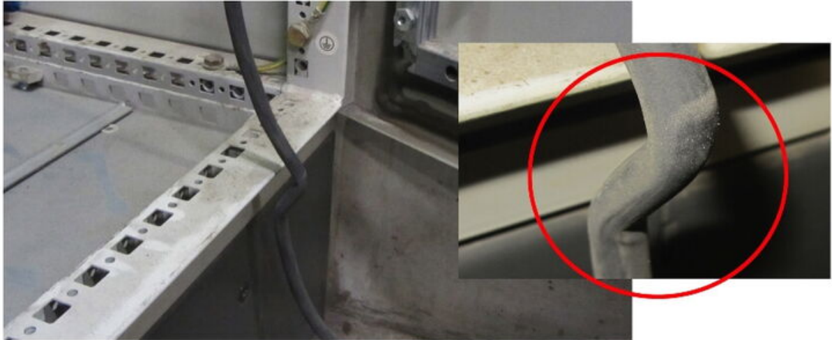
Ein typischer Installationsfehler.

In der Brandursachenstatistik des Instituts für Schadensverhütung und Schadensforschung (IFS) sind elektrische Anlagen und Betriebsmittel schon seit Jahren einsamer Spitzenreiter. Die Brandursachen elektrischer Anlagen sind sehr unterschiedlich.