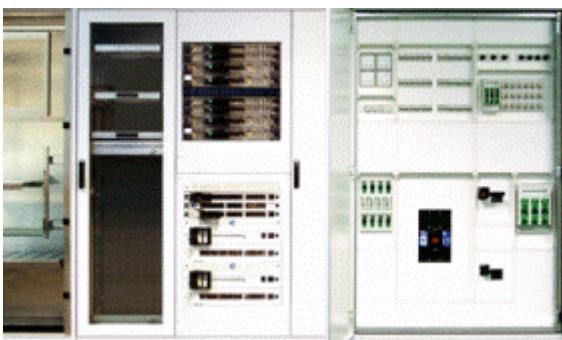
SK 3602 - Elektrische Anlagen

Der Prüfumfang für die Prüfung der elektrischen Anlagen nach Klausel „SK 3602“ ist damit umfassender und, aufgrund der Berücksichtigung der VdS-Richtlinien des Gesamtverbandes der Deutschen Versicherungswirtschaft e.V. (GDV), stark auf die Problemstellung der Brandschadenverhütung in elektrischen Anlagen ausgerichtet.