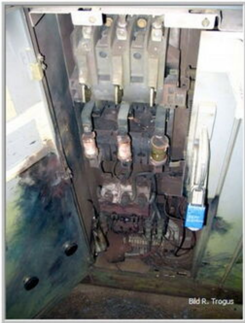
Abb.: Auswirkungen eines Lichtbogens (2)