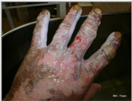
Abb.: Auswirkungen eines Lichtbogens (1)